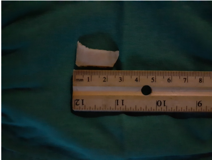
Fig. 3. Cuerpo extraño bronquial extraído.

Posterior a la extracción se realiza laringoscopia directa y se comprueba edema marcado en región interaritenoides y cuerdas vocales de color y movilidad normal, así como edema de la lengua y sangramiento escaso por la boca por lo que se decide realizar traqueostomía de urgencia.